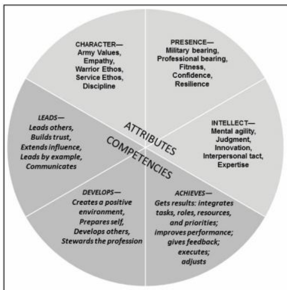
Figure 1-1. Army leadership requirements model

Атрибути - це бажані внутрішні характеристики лідера - те, якими армія вимагає лідерів бути та те, що армія вимагає від них знати. Компетенції – це лідерські навички та поведінка, які можна сформувати та розвинути у процесі професійної підготовки. Армія очікує, що лідери володіють необхідними якостями, постійно їх демонструватимуть і продовжать вдосконалюватися. Єдність компетенцій та атрибутів призводить до довіри між лідером та підлеглими, довіри, яка ґрунтується на організаційному підході та ефективній роботі в команді.