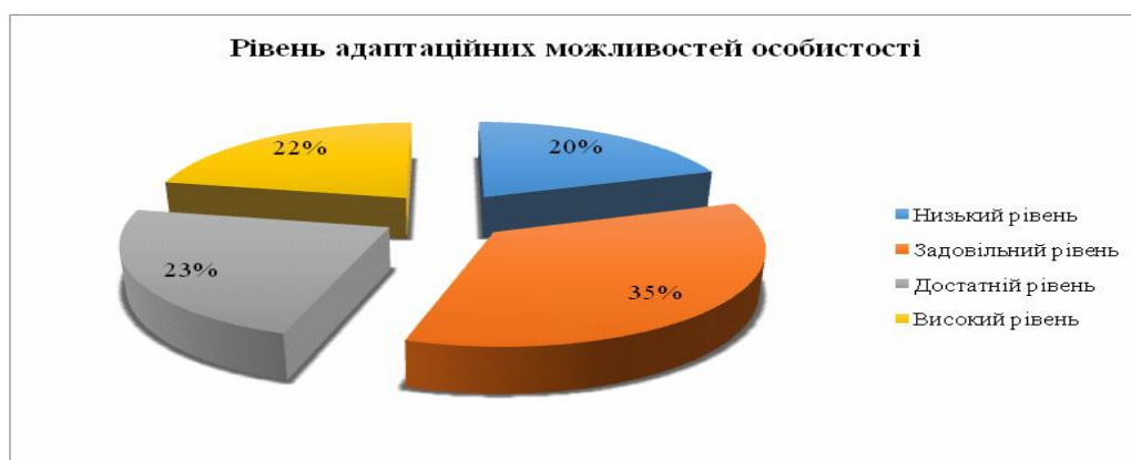
Рис.1. Рівень адаптаційних можливостей новобранців строкової служби

За отриманими результатами, ми можемо сказати, що у більшості новобранців процес адаптації пройде успішно, вони швидко налагодять міжособистісну взаємодію, групові інтереси у більшості з них стоять на порядок вище ніж особистісні.