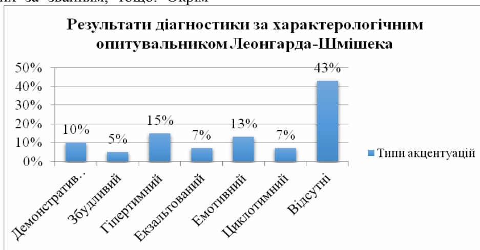
Рис.3. Типи акцентуацій новобранців строкової служби

Діагностика наявності та ступеня розвитку акцентуації характеру особистості з'ясувала, що у 42.5 % досліджуваних відсутні акцентуовані риси характеру. Серед усіх досліджуваних у 15% присутня гіпертимна акцентуація, у 10% респондентів демонстративна, у 5% осіб збудливий тип, у 7.5% досліджуваних екзальтований тип акцентуації, у 12.5% військовослужбовців емотивний тип акцентуації, у 7.5 % особистостей циклотимний тип акцентуації. Кількісні показники представлені на рис.3.