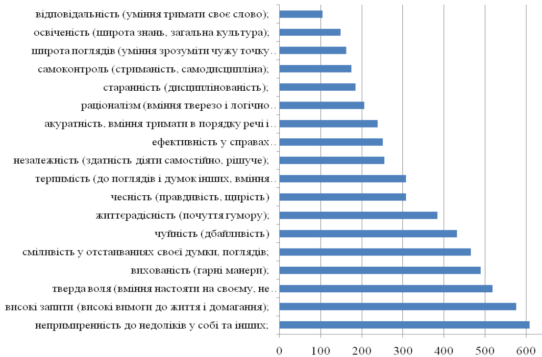
Рис. 2. Сума рангів при виборі інструментальних цінностей у вибірці офіцерів-психологів (36 осіб).

Рейтинг інструментальних цінностей офіцерів-психологів відображає особливості військової служби. В першій десятці пріоритетних якостей знаходяться відповідальність (почуття боргу, уміння тримати своє слово), самоконтроль і дисциплінованість, акуратність та охайність (вміння тримати в порядку речі та справи). Ці ціннісні орієнтири визначають змістовну сторону спрямованості особистості і складають основу її відношення до навколишнього світу, до інших людей, до себе самої, основу світогляду і ядро мотивації.