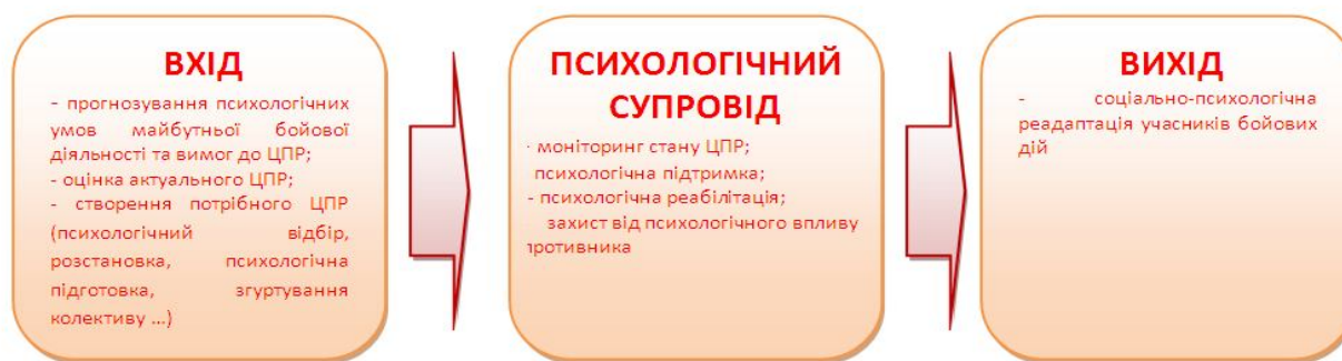
Рис.1.1 Логічна схема психологічного забезпечення бойових дій, запропонована О.Г. Караяні та І.В. Сиром'ятниковим.

Зазначеним дослідниками запропонована логічна схема ПЗ бойових дій військ (рис. 1.1):