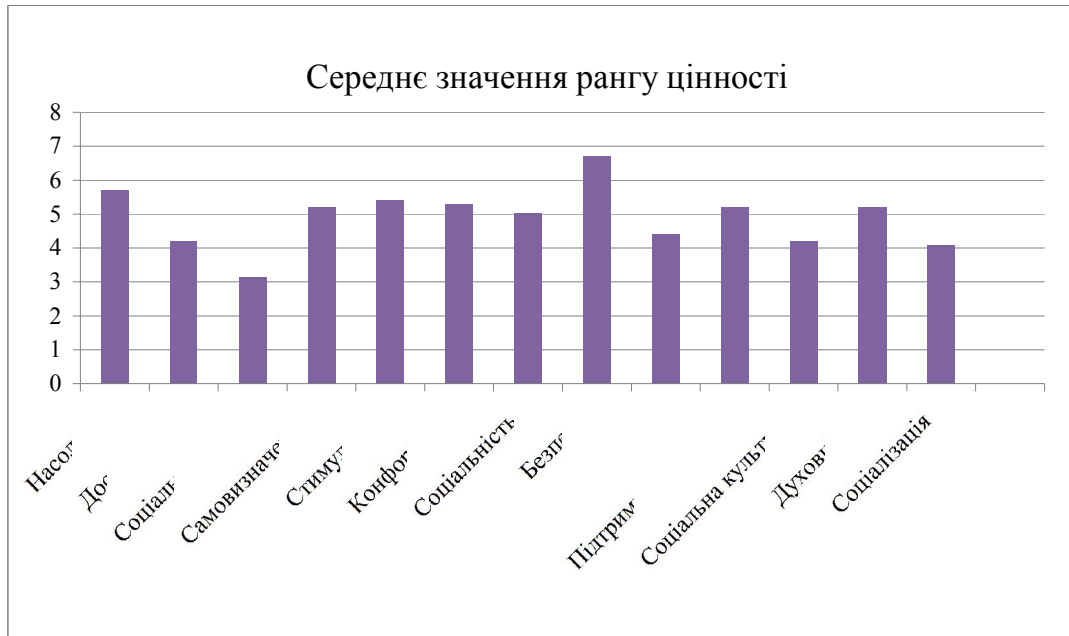
Ціннісні орієнтації учнів за методикою «Ціннісний опитувальник Шварца»

Виходячи з результатів тесту «Смисложиттєві орієнтації» можна сказати, що найбільше значення має локус контролю-життя (див. графік 2). Це є свідченням того, що школярі мають переконання в тому, що людині дано контролювати своє життя, вільно приймати рішення і втілювати їх у життя. Діти володіють високим рівнем суб'єктивного контролю над будь-якими значущими ситуаціями. Більшість досліджуваних вважає, що більшість важливих подій у їхньому житті було результатом їх власних дій, що вони