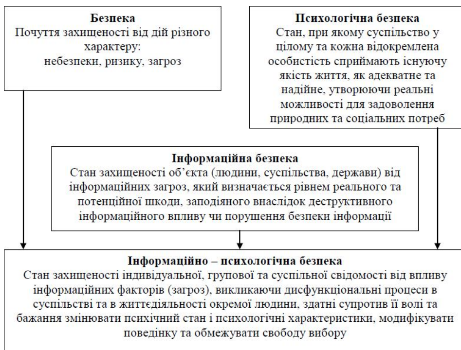
Рис 1. Інформаційно-психологічна безпека особистості.

Проінтерпретуємо такі базові поняття як: 1) безпека; 2) психологічна безпека; 3) інформаційна безпека; 4) інформаційно-психологічна безпека (рис. 1).