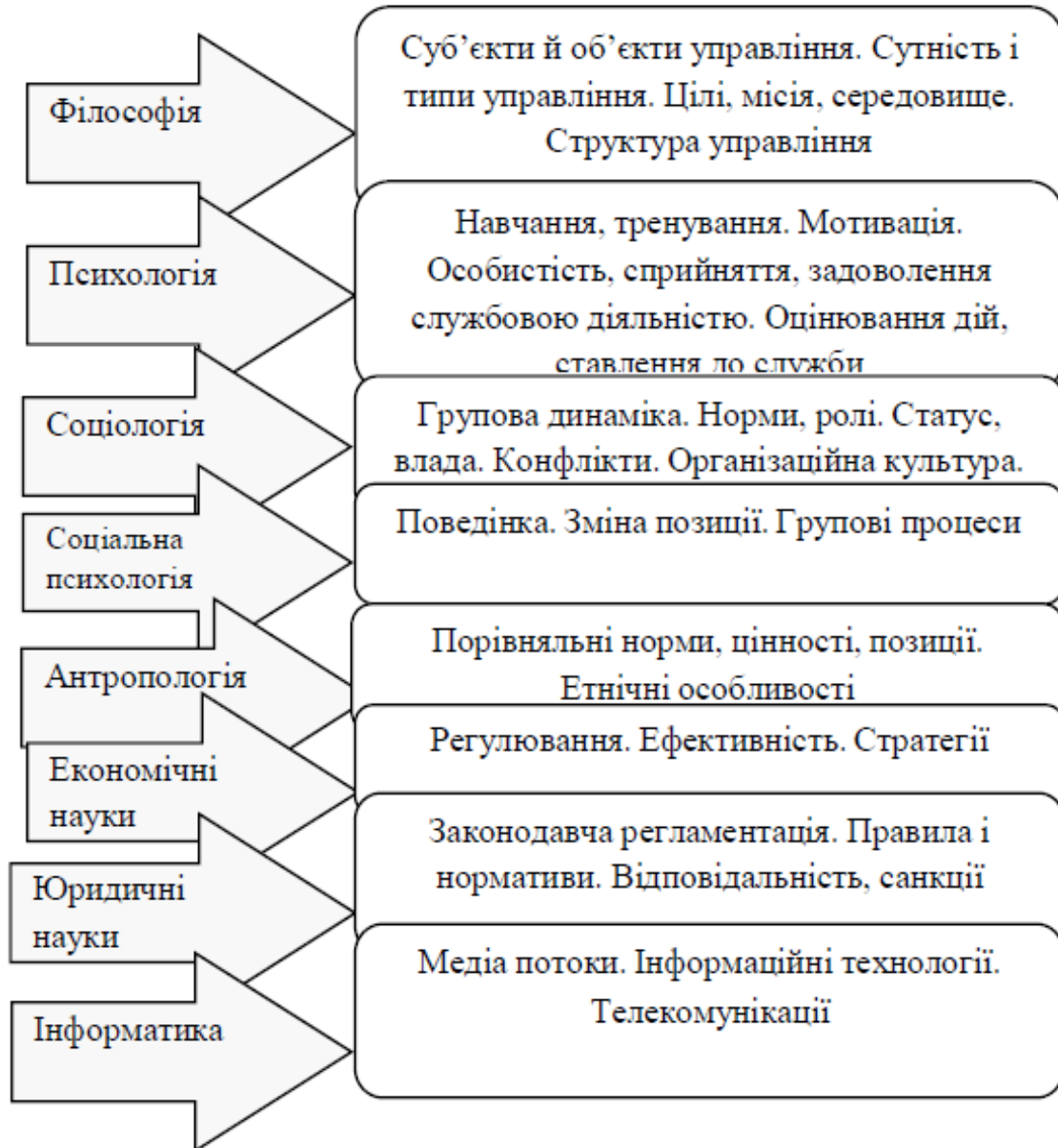
Рис. 2. Система наук про управління

Теорія воєнно-соціальної організації покликана використовувати досягнення гуманітарних наук (рис. 2).