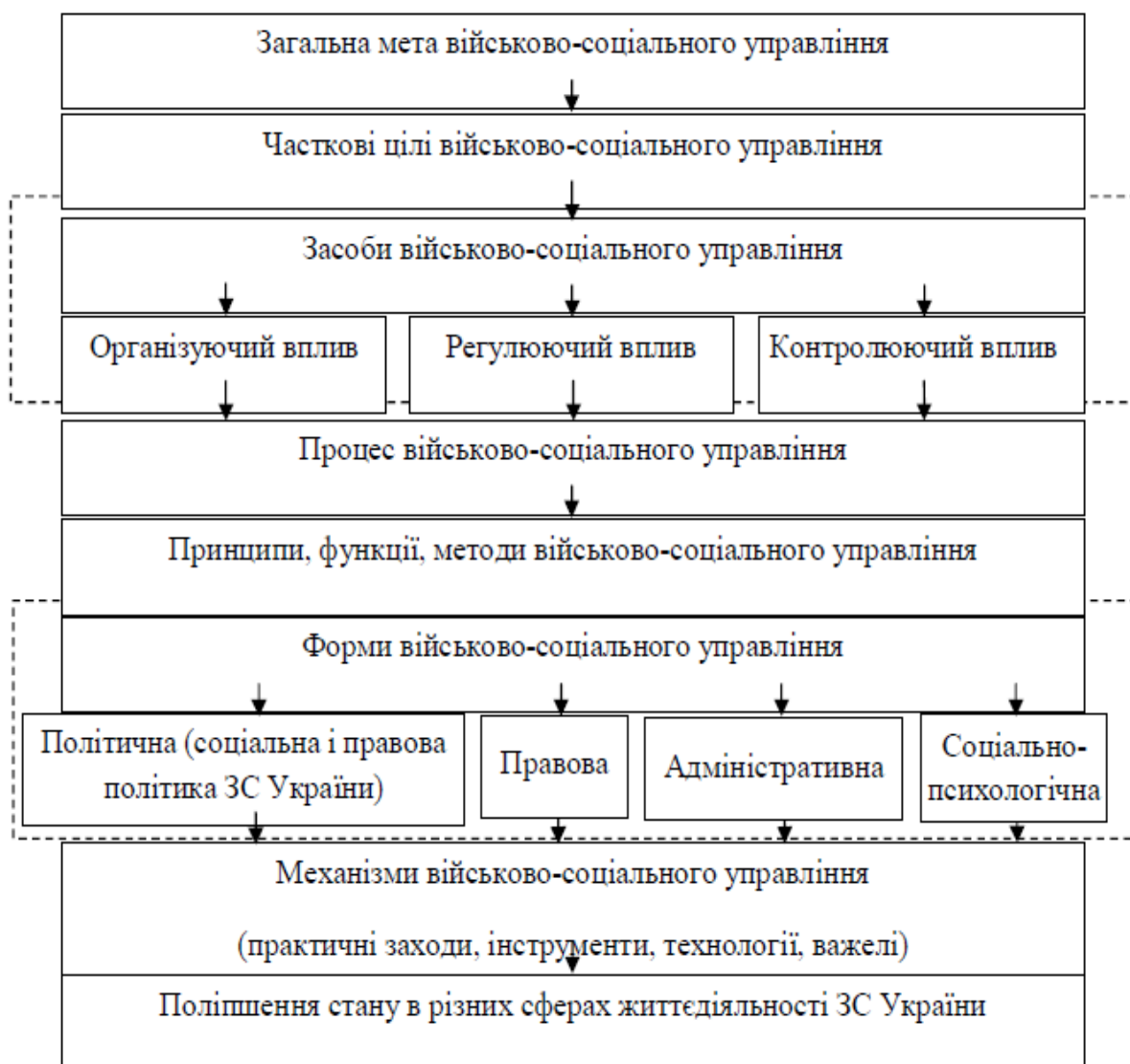
Рис. 3. Діяльніша модель військово-соціального управління

Діяльнішу модель військово-соціального управління наочно можна виразити наступною схемою (рис. 3):